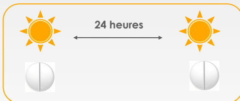
Schéma thérapeutique: J1 à J21 et reprise à J28(=J1)

Votre traitement doit être pris en une prise unique, à la même heure après le petit-déjeuner. Les comprimés doivent être avalés entiers avec un verre d'eau plate sans être mâchés ou écrasés.